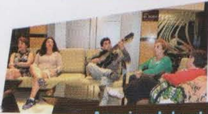
Amenizando la velada

XI. CENA CLAUSURA Se clausuró el Seminario con una cena preciosa Donde adiós le dijimos a la amable Villahermosa Por esa música tan alegre que tanto ritmo tenía Todos quisieron bailar con muchísima alegría Y la artista que cantaba con esa voz tan bonita Alegraba más la cena: La cena de despedida Y cuando al final canto: No llores por mí Argentina A todos nos conmovió, aquella tierna canción Decirle a Tabasco adiós y esa noche tan divina.