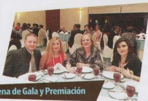
Cena de Gala y Premiación