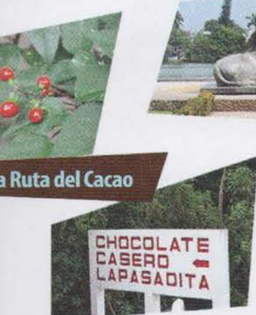
Ruta del Cacao