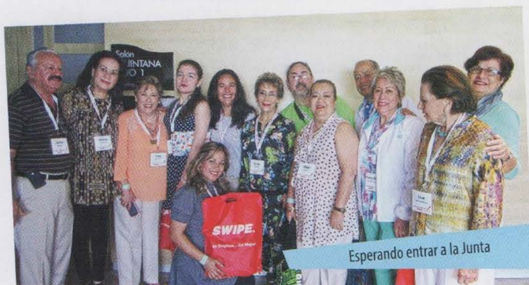
Esperando entrar a la Junta