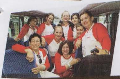
El ambiente del autobús

IX. RUTA DEL CACAO-MUSEO DE LA VENTA Otra desmañada que valió mucho la pena Pues ese día tuvimos dos paseos importantes: A la ruta del cacao y al museo de la venta. Paseos interesantes y además muy cultural.