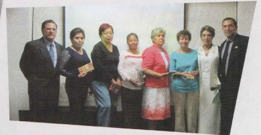
Swipers premiados por asistencias a Juntas

A todos ellos les expresamos nuestro reconocimiento por su entusiasmo y dedicación y los felicitamos deseándoles que este año 2016 vuelvan a alcanzar sus metas, ya que han demostrado que pueden hacerlo. ¡Mil Felicidades!; y a los que no llegaron por diferentes circunstancias les decimos: ¡Animo! y repitan constantemente nuestro lema 2016: "El éxito es Mío con SWIPE" .