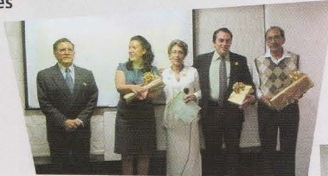
Premiación Vendedores Institucionales