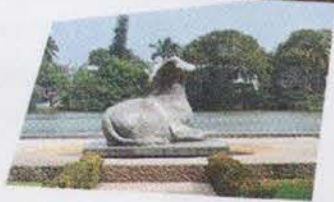
Museo de la Venta