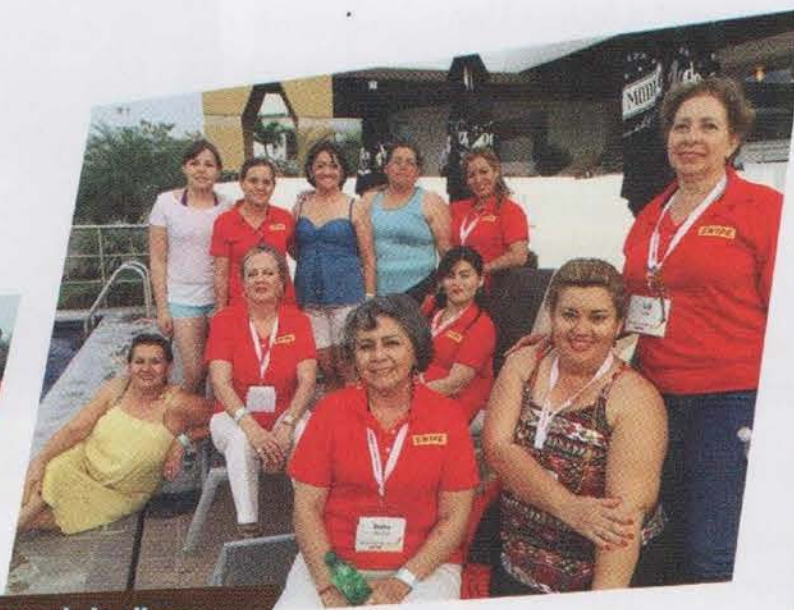
Gozando la alberca