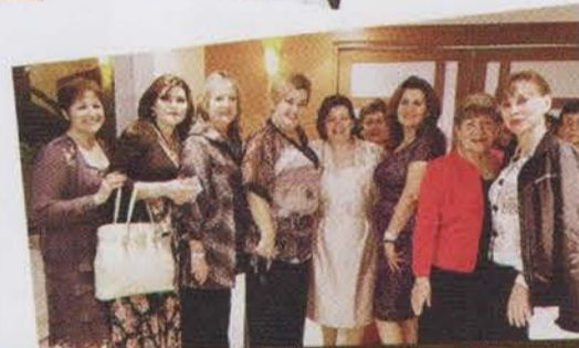
Llegando a la Cena de Gala y Premiación