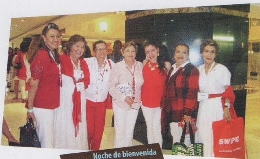
Noche de bienvenida