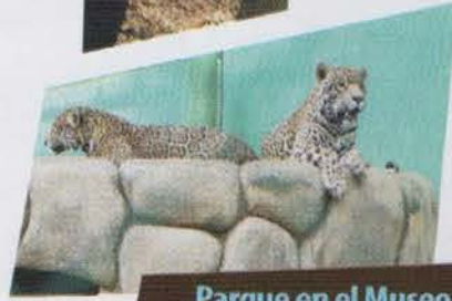
Parque en el Museo

• Museo de la Venta El Museo de la Venta que es orgullo de Tabasco Se encuentra al aire libre por lo que parece un parque; Tiene un pequeño safari con algunos animales: Leones y guacamayas, el famoso cocodrilo Y de diversos colores también están los jaguares. Algunas piezas arqueológicas: Cabezas de los Olmecas, como también de los Mayas Perfectamente cuidadas que en éste museo están La naturaleza en este lugar es frondosa y abundante. Porque Carlos Pellicer, fundador de este museo, esa fauna y esa flora Siempre quiso proteger.