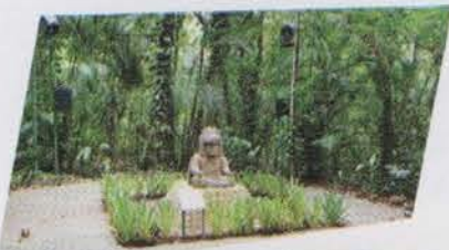
Sin duda Tabasco es un Edén

Y este gran Seminario estuvo tan bien planeado Que todos nos la pasamos increíblemente bien Y por eso aconsejamos: