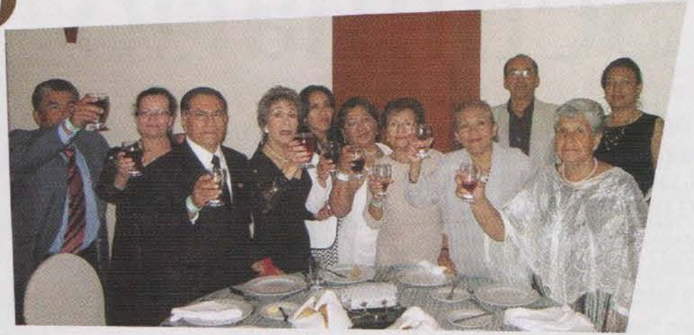
Grupo SWIPE Oaxaca celebrando el primer lugar en Ventas Línea Doméstica