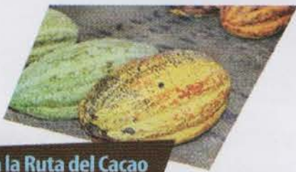
Hacia la Ruta del Cacao

Y fue en este lugar nuestra muy rica comida, Entre gran vegetación, una alberca gigantesca Con jardines que rodeaban nuestro lindo restaurant, Y aquel río que cruzaba la selva y los jardines, Entre nosotros pasaba y era algo excepcional. Todo era un paraíso que no puedo descifrar. Y de este hotel tan imponente como es el de Cham-Kha, Siempre hemos de recordar: la deliciosa comida Su belleza exuberante y un mágico lugar.