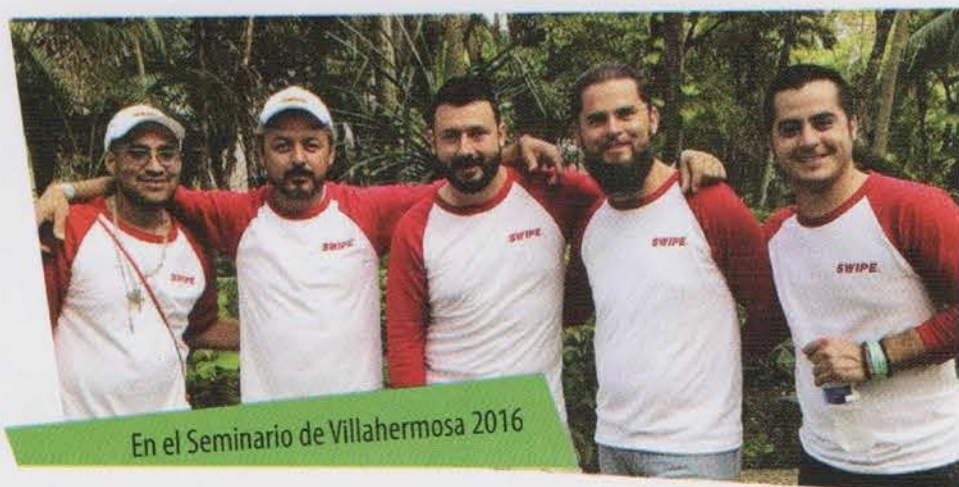
En el Seminario de Villahermosa 2016