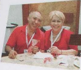
Cena de Bienvenida