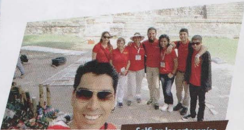
Selfi en las artesanías