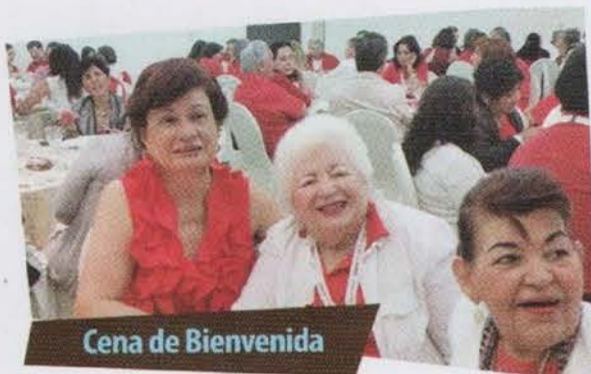
Cena de Bienvenida