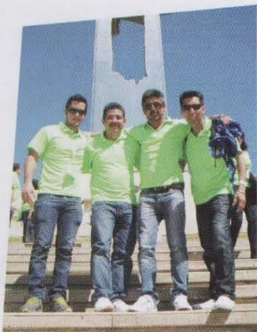
En el Seminario de Tuxtla Gutiérrez 2015