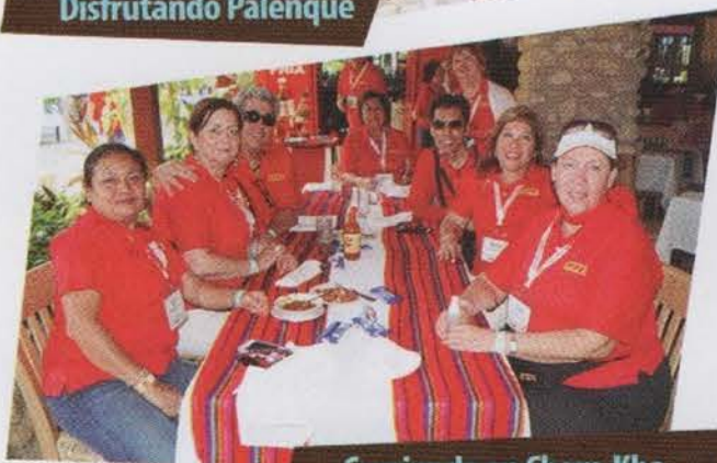
Comiendo en Cham-Kha