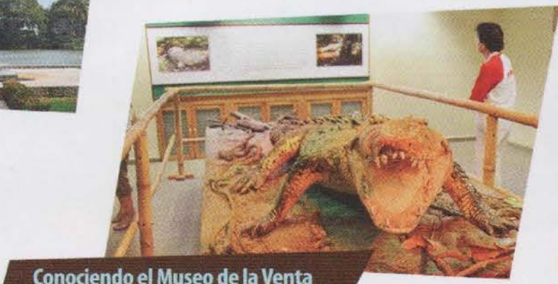
Conociendo el Museo de la Venta