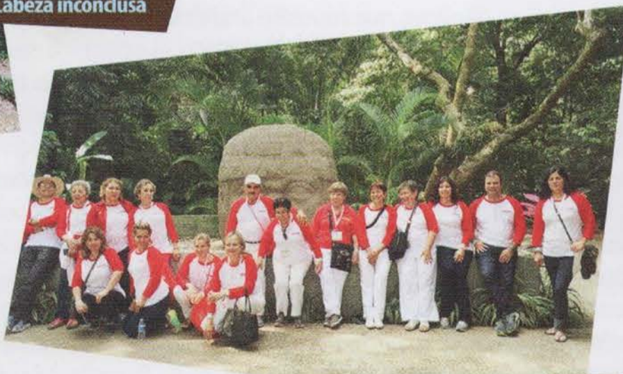
Reunión en la Cabeza Olmeca