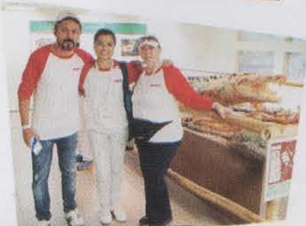
Museo de la Venta

X. COMIDA EN EL EDÉN Después a la comida muy cerca de ese lugar Donde con todos los Swipers nos pudimos encontrar Comimos muy delicioso y la pasamos muy bien Porque en ese restaurant que se llama El Edén La comida es abundante y la atención muy cordial.