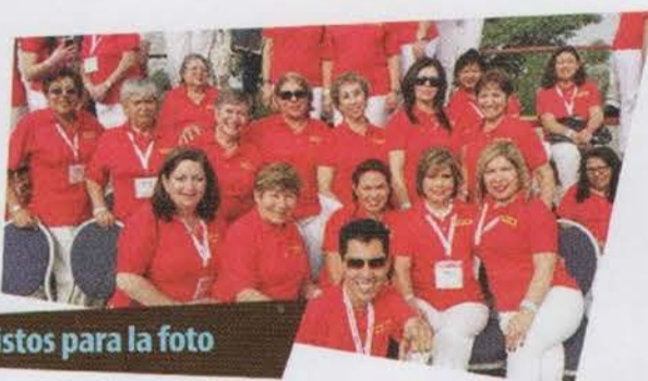
Listos para la foto