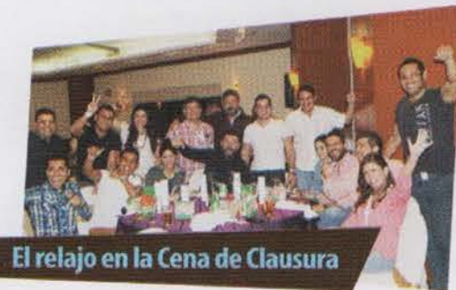
El relajo en la Cena de Clausura